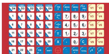
Tastiera alta resistenza