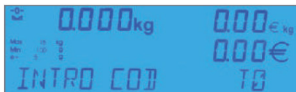
DISPLAY LCD ALFANUMERICO RETRO ILLUMINATO